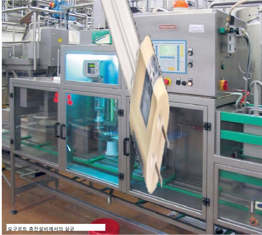
요구르트 충전설비에서의 살균